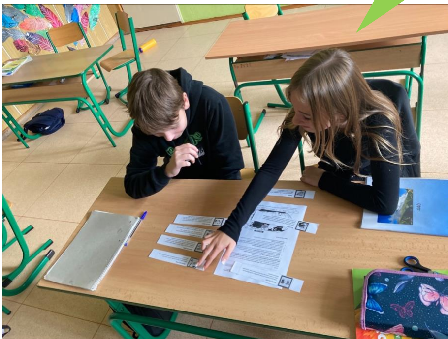
Základní škola Ilji Hurníka Opava