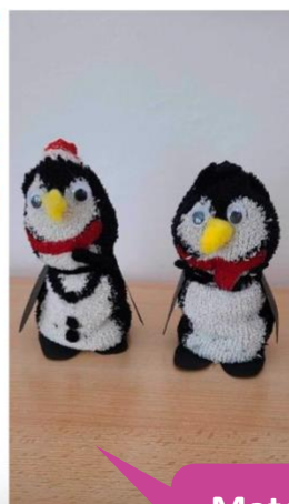
Mateřská škola Pohádka, Šumperk