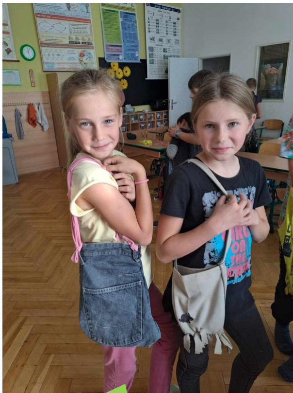
Základní škola a mateřská škola Nesovice