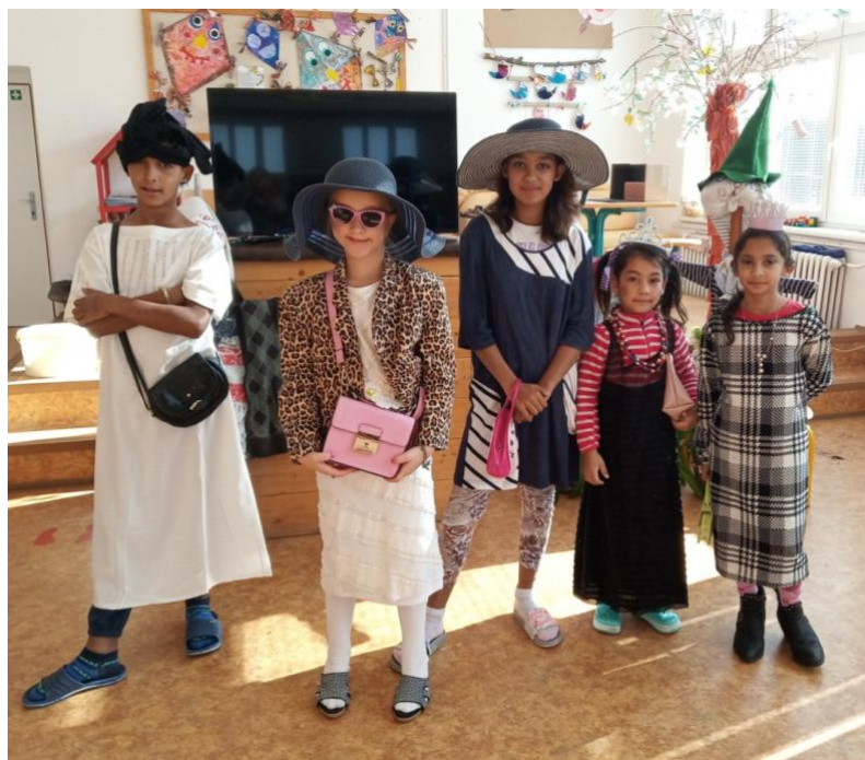
Základní škola Hranice, okres Cheb