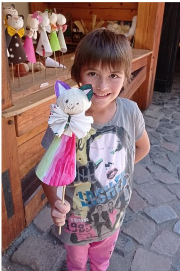
ZŠ a MŠ Vlastějovice