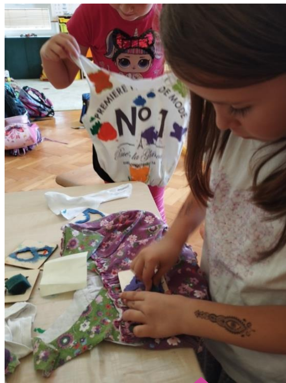
Základní škola a mateřská škola Perálec