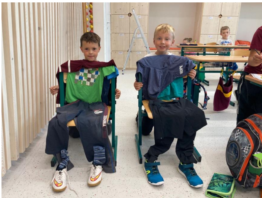
Základní škola a Mateřská škola, Studenec