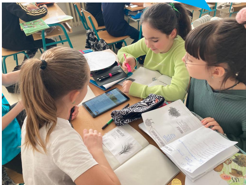
Základní škola, Hradec Králové, Habrmanova