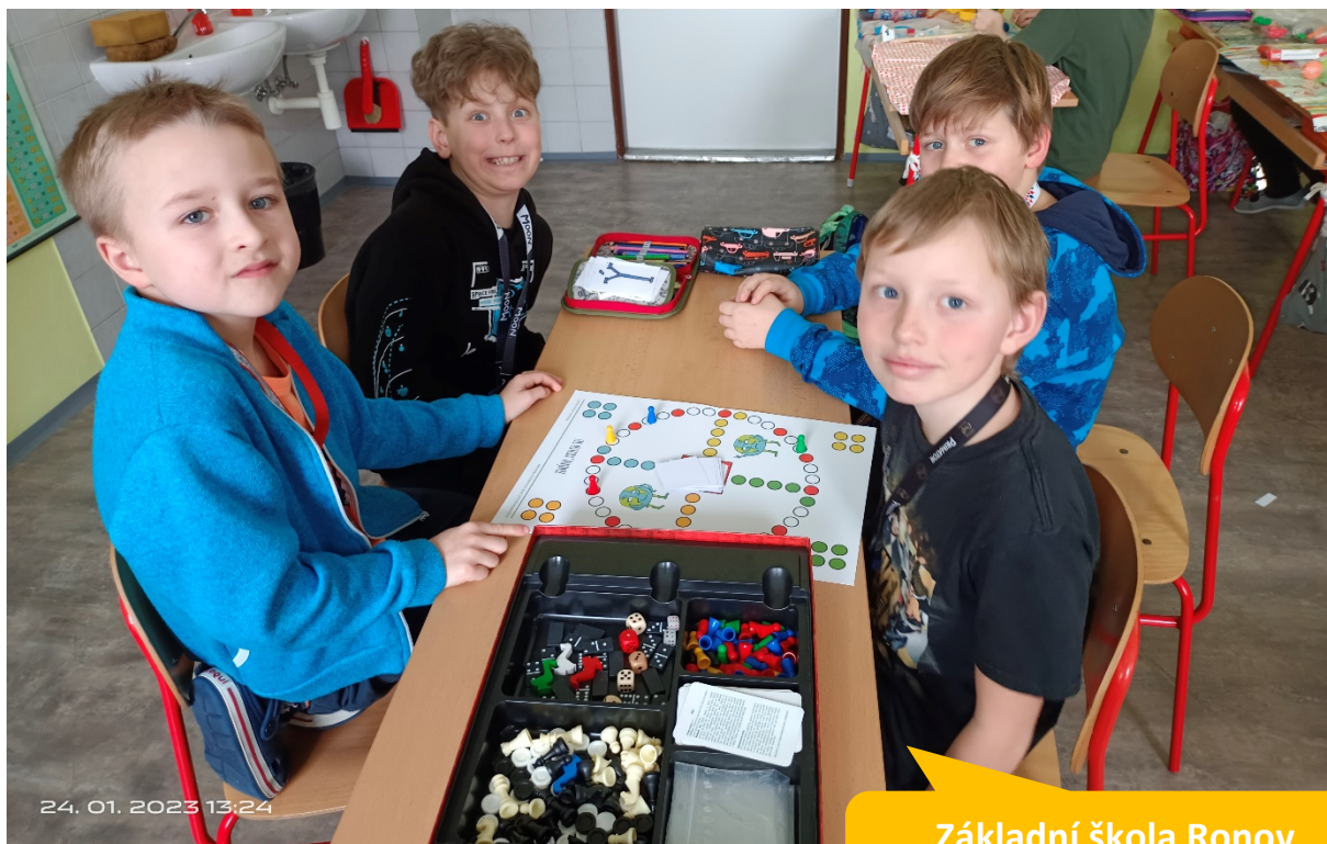
Základní škola Ronov nad Doubravou