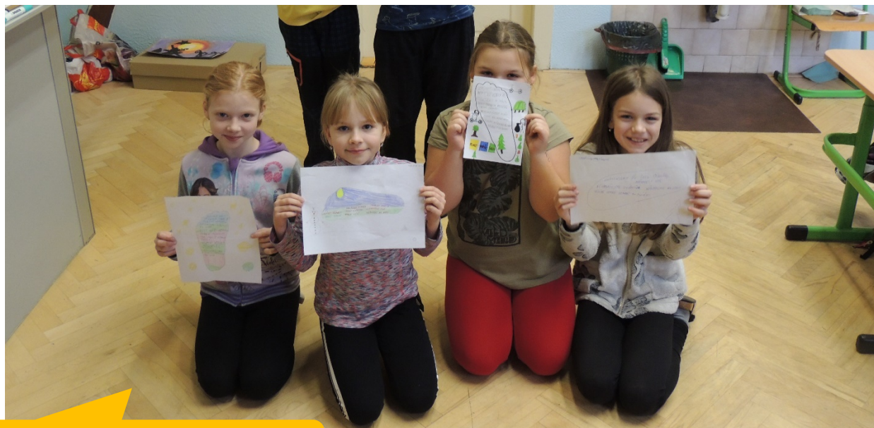
Základní škola Karlovice