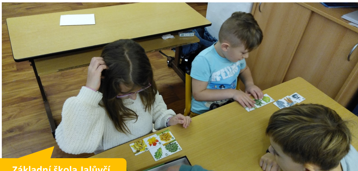
Základní škola Jalůvčí