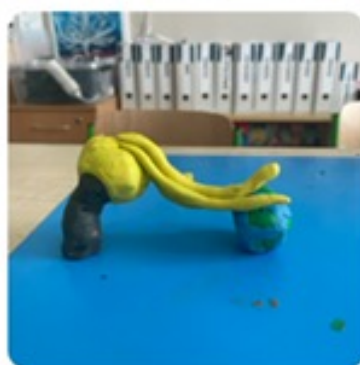
Základní škola Hrob