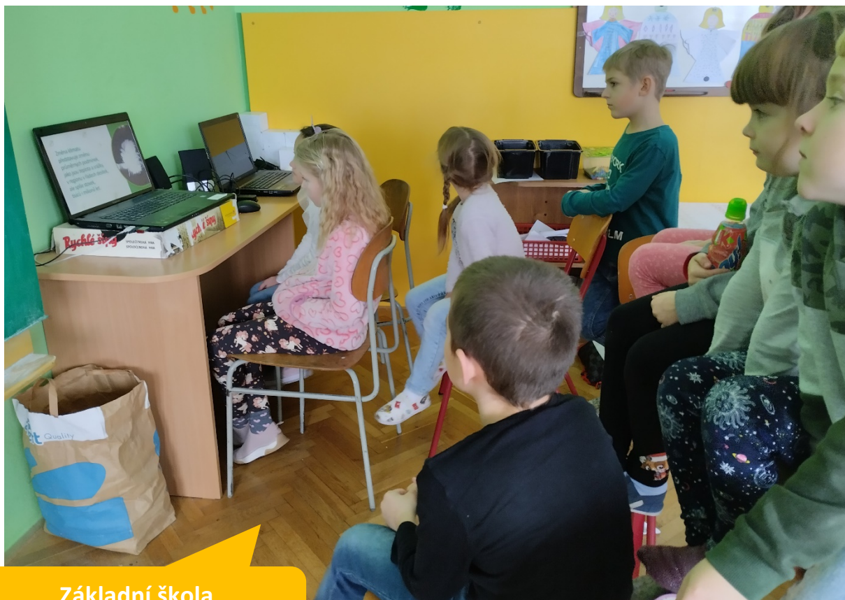
Základní škola a Mateřská škola Bezměrov