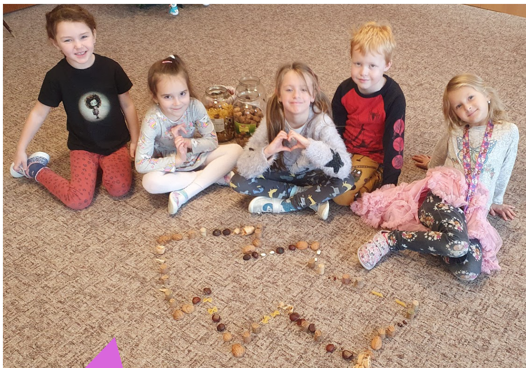
Mateřská škola Brno, Šromova