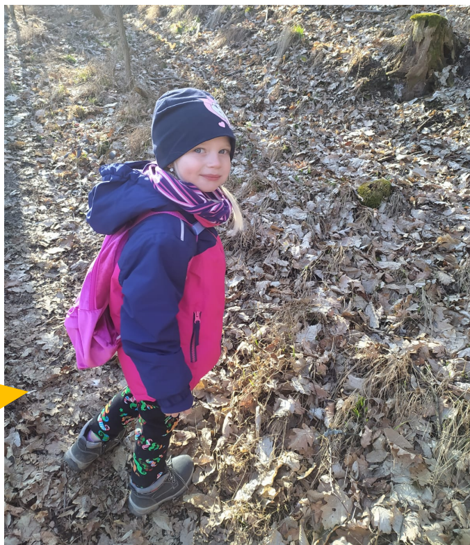
Základní škola a Mateřská škola Dolní Loučky