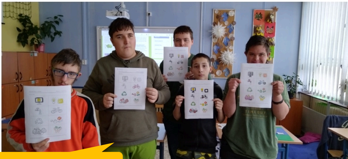
Základní škola, Rokycany