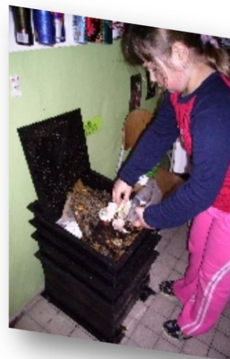
ZŠ Záboří nad Labem