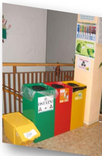
ZŠ Borovského, Karviná