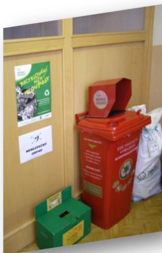
ZŠ a MŠ Jedlí