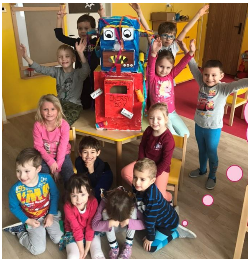
MŠ Otakara Březiny, Žatec