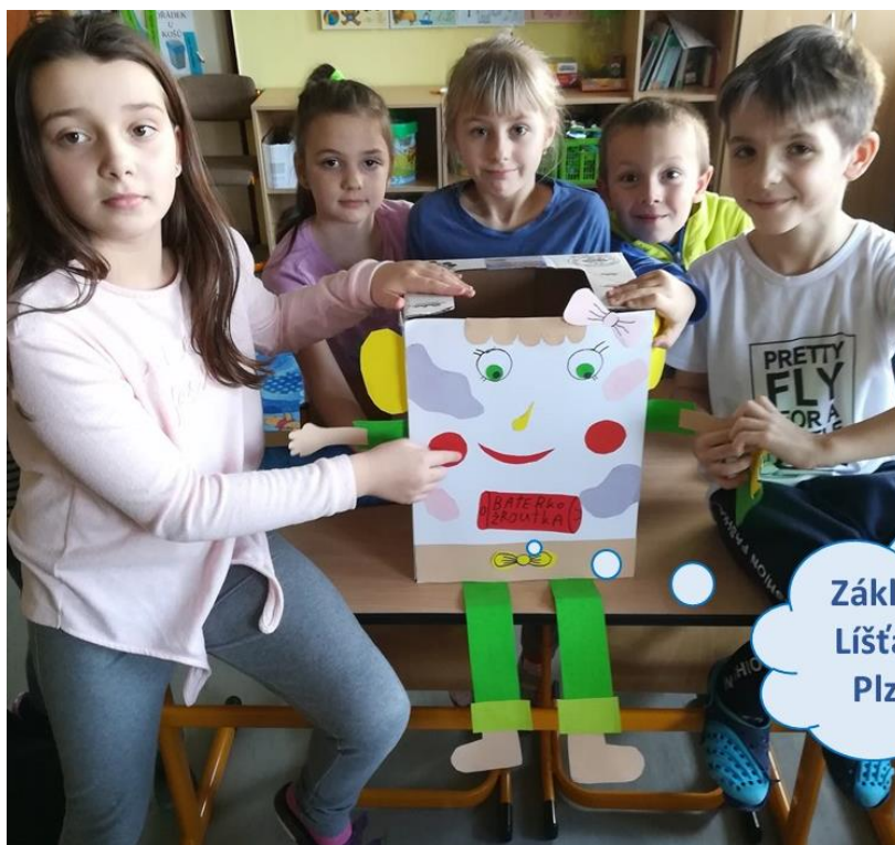
Základní škola Líšťany, okres Plzeň-sever