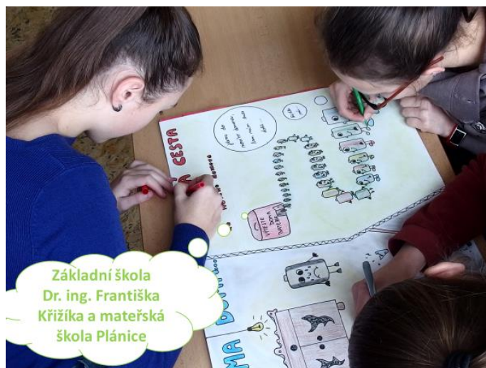
Základní škola Dr. ing. Františka Křížíka a mateřská škola Plánice