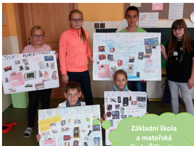
Základní škola a mateřská škola Čížkovice