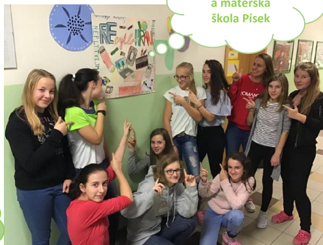
Základní škola a mateřská škola Písek