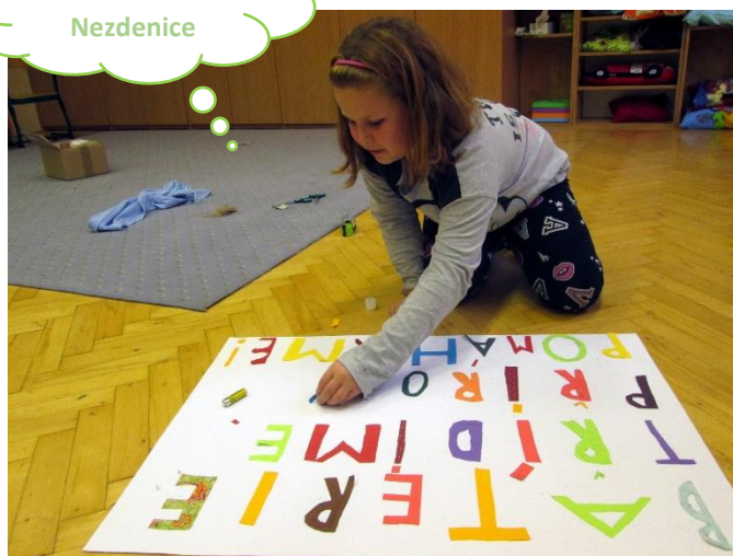
Základní škola Nezdenice