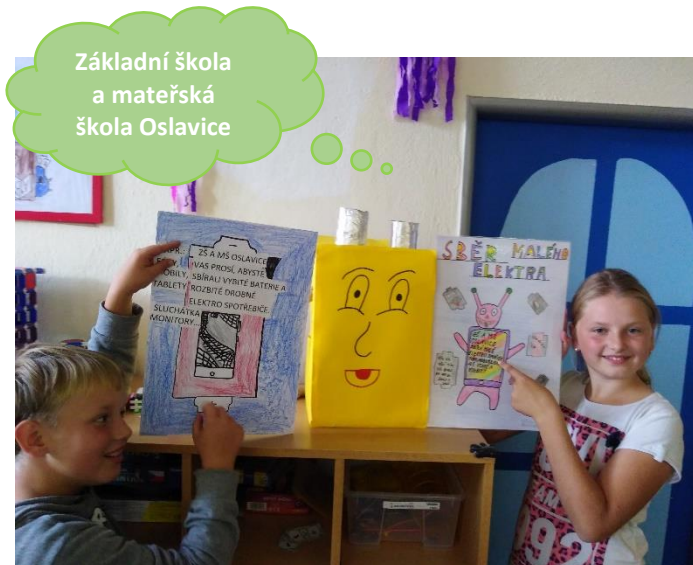
Základní škola a mateřská škola Oslavice