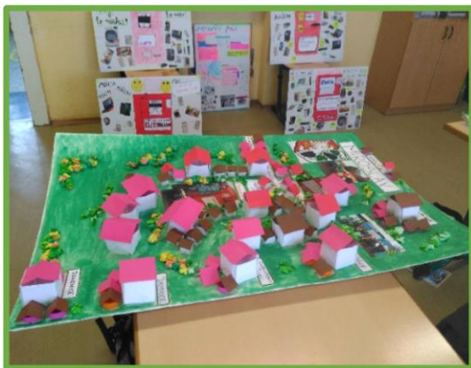
ZŠ Miroslav, JHM