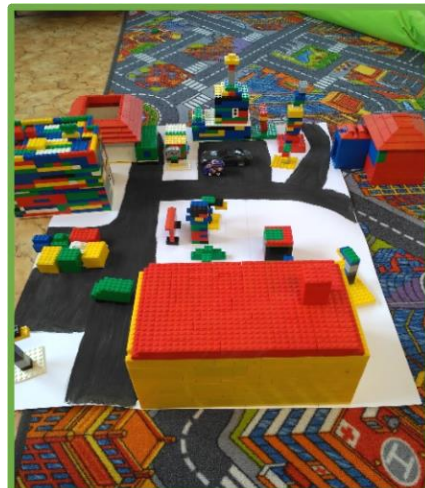
ZŠ Vojnův Městec, Vysočina