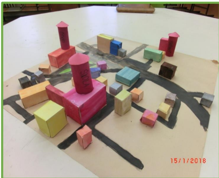
ZŠ Opařany, JČ