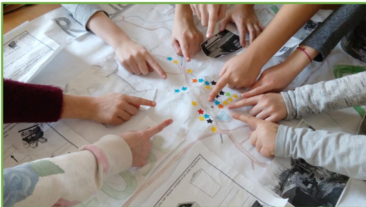
ZŠ a MŠ Přerov nad Labem, Středočeský