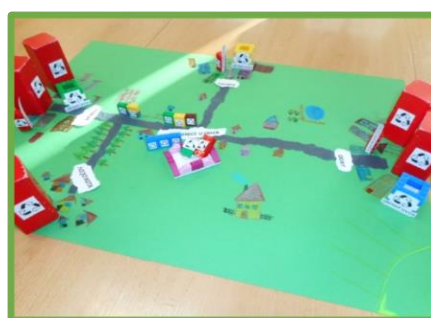
ZŠ Heřmanice u Oder, MSK