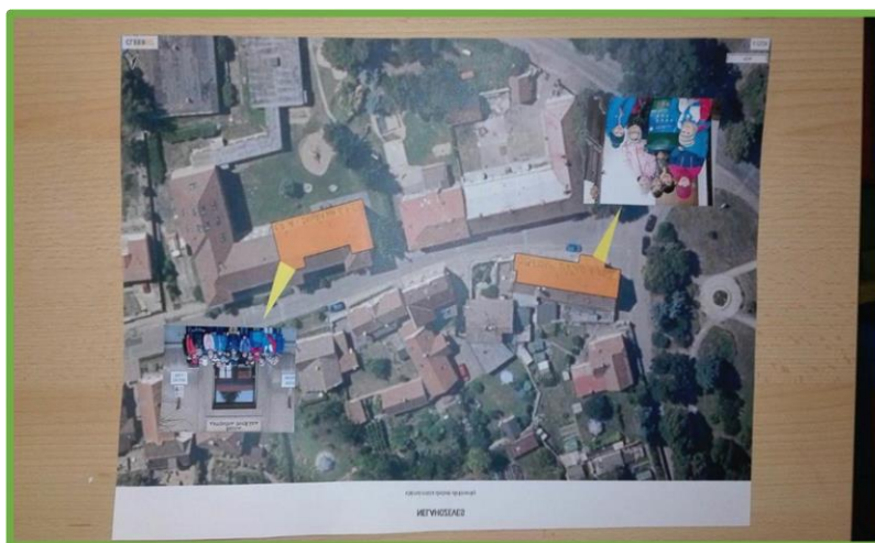
ZŠ Nelahozeves, Středočeský