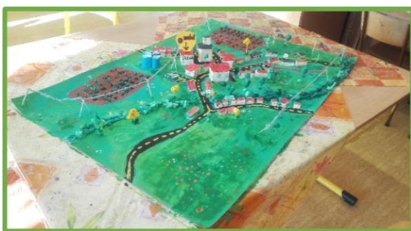
ZŠ Laškov, OL