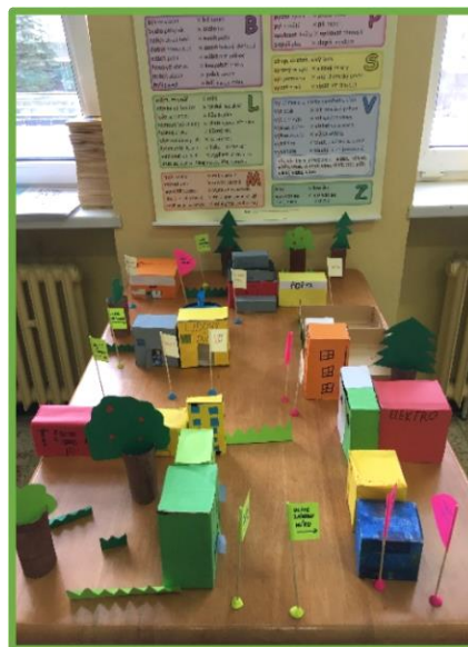
ZŠ Karlovy Vary, Truhlářská, KV