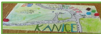
ZŠ a MŠ Kanice, JM