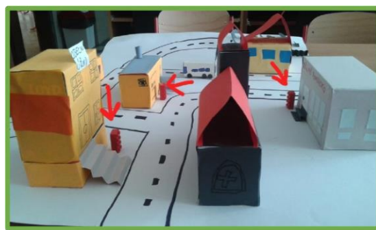
ZŠ a MŠ Rovensko, OL