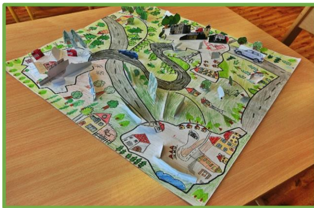
ZŠ Tři Sekery, KV