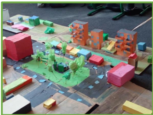
ZŠ a MŠ Krásný dvůr, Ústecký